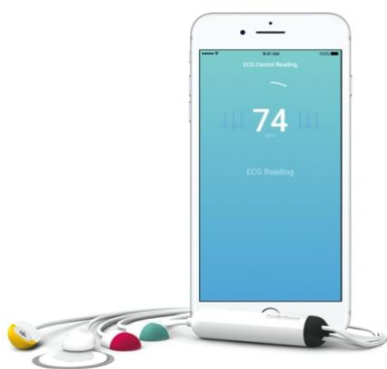
CardioSecur zeichnet valide EKG Daten auf und gibt eine sofortige Handlungsempfehlung.

Weitere Informationen unter www.cardiosecur.com